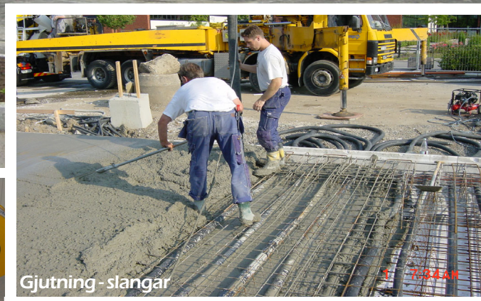
Gjutning - slangar